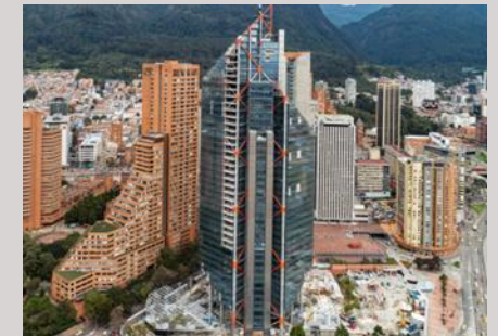
Edificio Atrio PEI Asset Management Bogota, Colombia