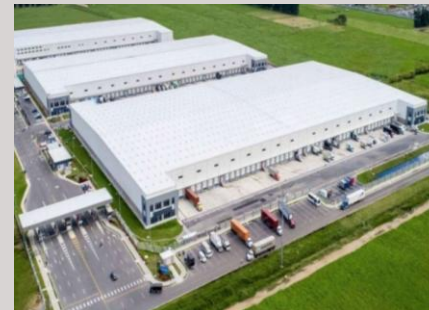
Parque Industrial Logístico LatAm, Logistic Properties of the Americas Tenjo, Colombia