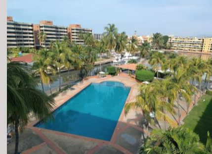
Unidad Residencial – Apto Dúplex Conjunto Residencial Plaza Marina Lecherías, Edo. Anzoátegui