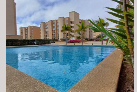
Unidad Residencial – Apto Conjunto Residencial Casa Caribe Porlamar, Isla de Margarita